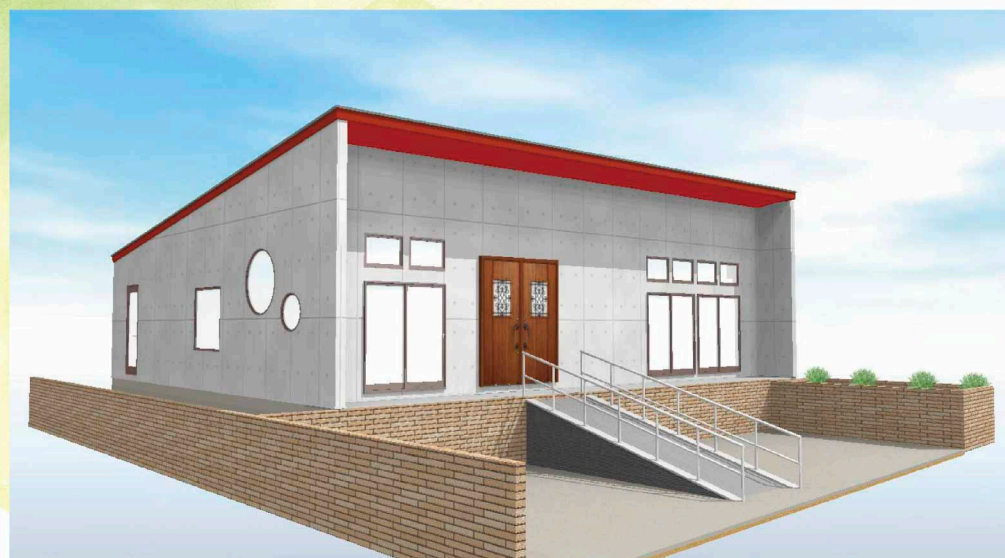
※掲載のバースは図面を基に描き起こしたもので実際とは多少異なる場合があります。※パンフレットに掲載のイラストは全てイメージです。